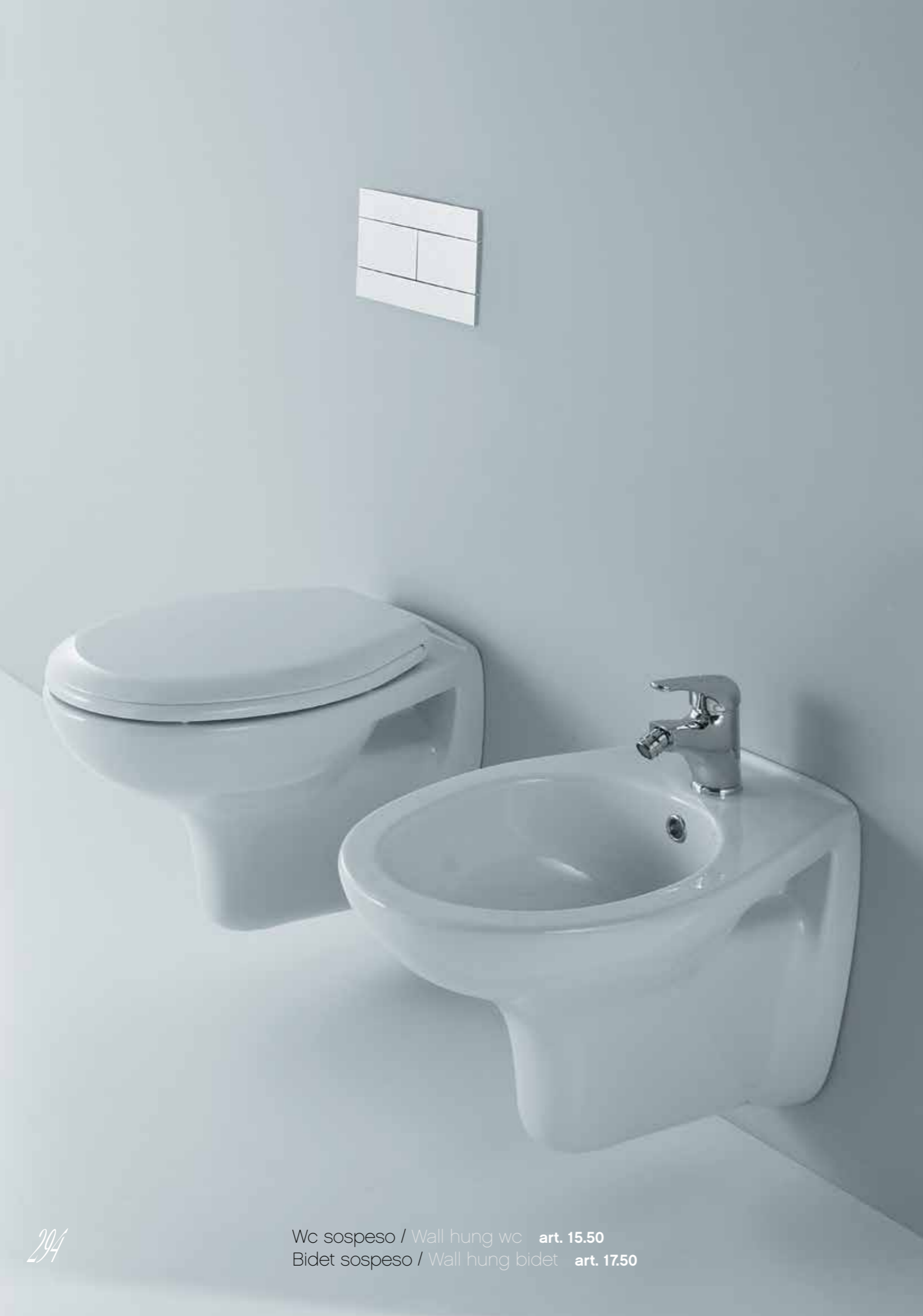
294 Wc sospeso / Wall hung wc art. 15.50 Bidet sospeso / Wall hung bidet art. 17.50