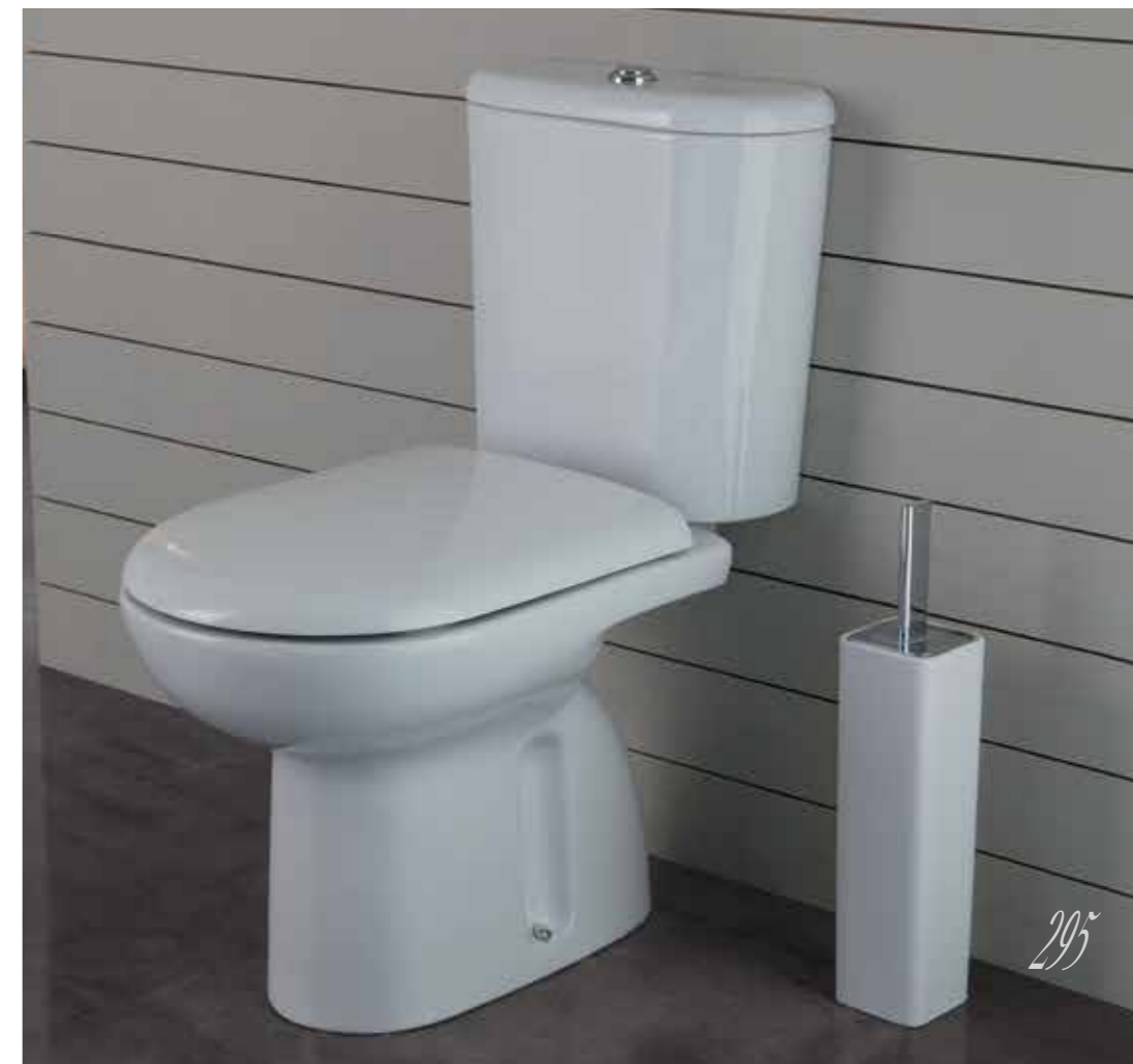
Wc monoblocco / Wc pan art. 0350 cassetta per monoblocco / cistern for Wc pan art. 12RN