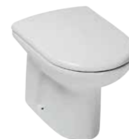
art. 0150 / 0250 Wc terra cm56 Free standing wc cm56