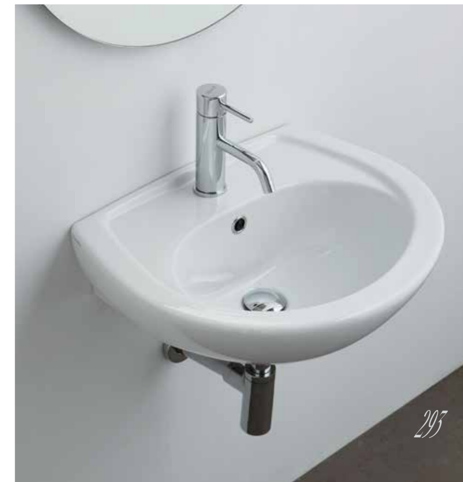
Lavabo cm 52 / Washbasin cm 52 art. 3120 Semicolonna / Semi Pedestal art. 16UN