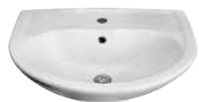
art. 0820 Lavabo cm65x52 Washbasin cm65x52