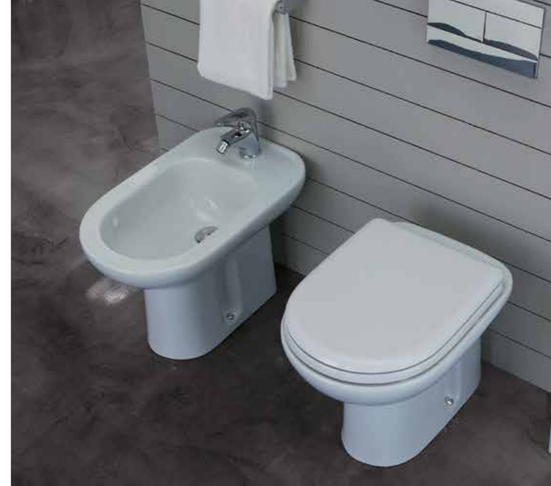
Wc a terra / freestanding Wc art. 0150 bidet a terra / freestandin bidet art. 0550