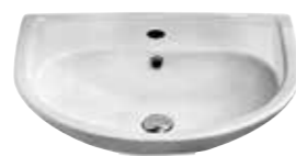
art. 0920 Lavabo cm60x45 Washbasin cm60x45