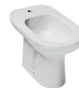
art. 0550 Bidet terra cm 56 Free standing bidet cm56