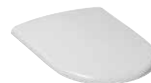
art. C600 Copriwater in termoindurente Thermosetting sit cover art. C800 Copriwater in termoindurente soft close Soft closethermosetting sit cover art. C1RV Copriwater in poliestere Seat cover polywood

disponibili per - available for art.0150 / 0250 / 0350 / 0450