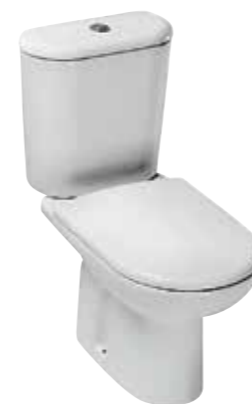
art. 0350 / 0450 + art. 12RN Wc monoblocco cm65 Wc pan cm65 Cassetta per monoblocco Cistern for wc pan