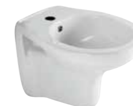
art. 1750 Bidet sospeso cm51 Wall hung bidet cm51