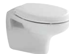
art. 1550 Wc sospeso cm51 Wc wall hung cm51