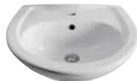
art. 3120 Lavabo cm52x43 Washbasin cm52x43