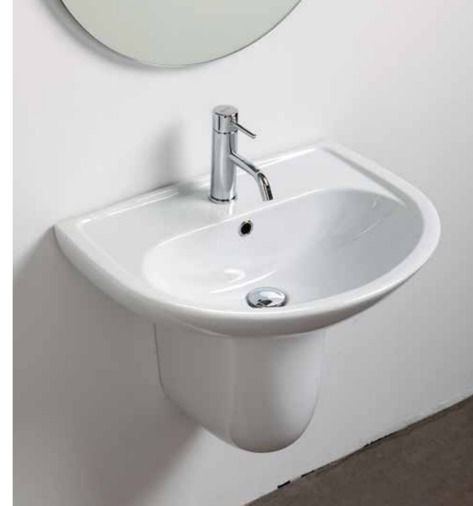
Lavabo cm 60 / Washbasin cm 60 art. 0920 Semicolonna / Semi Pedestal art. 16UN